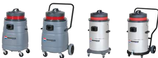
SM 50 B AC